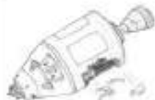
Σκίνα: Φίλος βινυλάντιος Α1