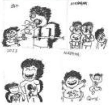
Είδη: Θάνος Κολοκοιτίδης Κ2

Άλλη μια ευκαιρία που μας δόθηκε ήταν να κάνουμε ένα αφιέρωμα για τα 50 χρόνια από την επέτειο της εξέγερσης του Πολυτεχνείου, με μια συνέντευξη με τη γνωστή ιστορική Τασούλα Βερβενιώτη.