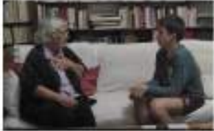
από τον Χρήστο Κωνσταντινίδη

Συνέντευξη από την ιστορική (και γιαγιά) Τασούλα Βερβενιώτη για τις μέρες του Πολυτεχνείου το '73